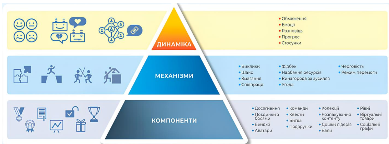
Рисунок 1 - Трирівнева піраміда Кевіна Вербаха [6]

Застосування цієї теоретичної моделі в освітньому процесі дозволяє не лише підвищити мотивацію та залученість студентів, але й сприяє розвитку критичного мислення, креативності та соціальних навичок. Використання ігрових елементів допомагає створювати інтерактивне навчальне середовище, що стимулює активне залучення студентів та забезпечує глибоке засвоєння навчального матеріалу.