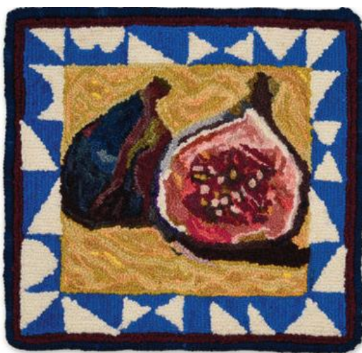
Рисунок 1 – Килим виконаний пунш-голкою

оскільки ціна все ще була далеко за межами діапазону для більшості жителів сільської Америки, творчі, винахідливі жінки в цих місцях почали розробляти власні методи створення килимів для своїх домівок. Фермерські громади мали доступ до мішковини з мішків для корму, тож ці жінки почали використовувати невеликий металевий гачок із дерев'яною ручкою (схожий на гачок для в'язання), щоб протягувати смужки тканини, зокрема старий одяг і ганчір'я, через мішковину, щоб зробити її щільною. Так виготовлялися петельні покриття для підлоги. У перші роки ці дизайни були досить невибагливими, і виготовлення таких килимів часто вважалося ремеслом бідності. Але з часом дизайн вдосконалювався. У цій техніці почали створювати маленькі килими для дому, які були не лише практичними, але й художніми, розробляючи власні унікальні візерунки відповідно до особливостей інтер'єру своїх домівок та власних вподобань (рисунок 1).