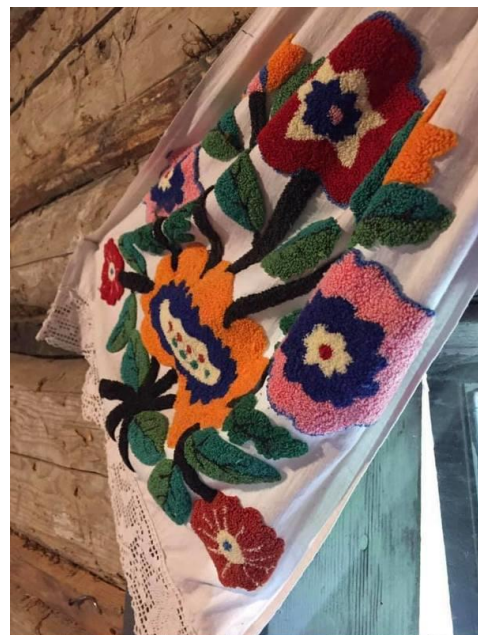
Рисунок 3 – Ужиткові речі виконані у техніці килимової вишивки