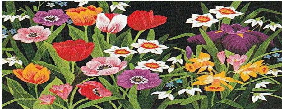
Рисунок 2 – Японська вишивка килимовою голкою

В Україні техніка килимової вишивки почала набувати популярності у ХХ ст. Полонені і жінки-військові, повертаючись додому після другої світової війни, привезли її з собою з Німеччини. Це було щось нове, доступне, просте у виконанні та красиве. Кожен міг проявити свій творчий потенціал у даному виді декоративно-прикладного мистецтва.