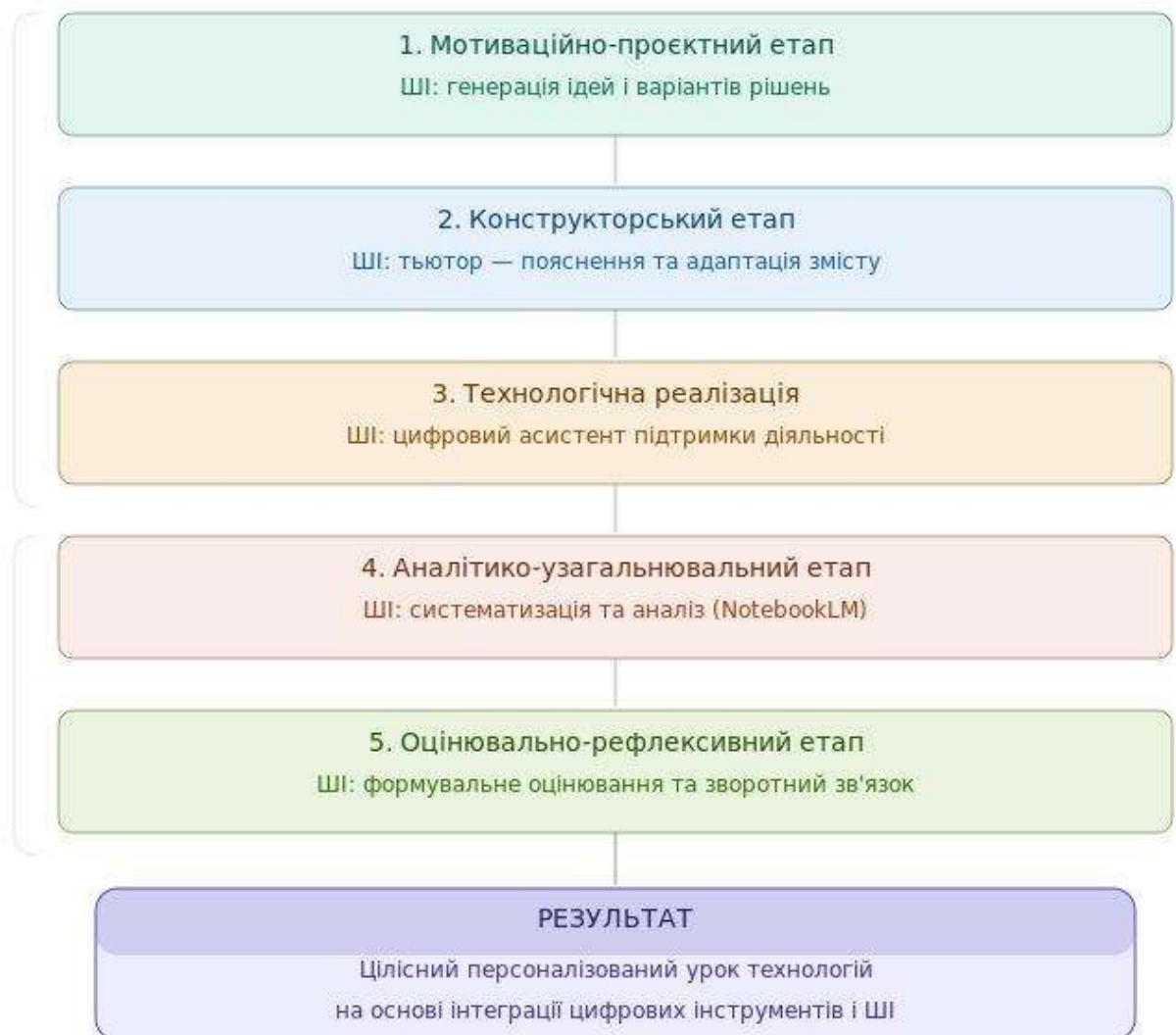
Рис. 1. Структурно-функціональна модель інтеграції штучного інтелекту в урок технологій

У межах проєктно-технологічної діяльності штучний інтелект доцільно розглядати як багатофункціональний дидактичний інструмент, що змінює роль залежно від етапу навчального процесу: генератор ідей (проєктування), тьютор (навчання), аналітик (узагальнення матеріалів) та інструмент формувального оцінювання (рефлексія). Така модель забезпечує системну інтеграцію ШІ в логіку уроку технологій.