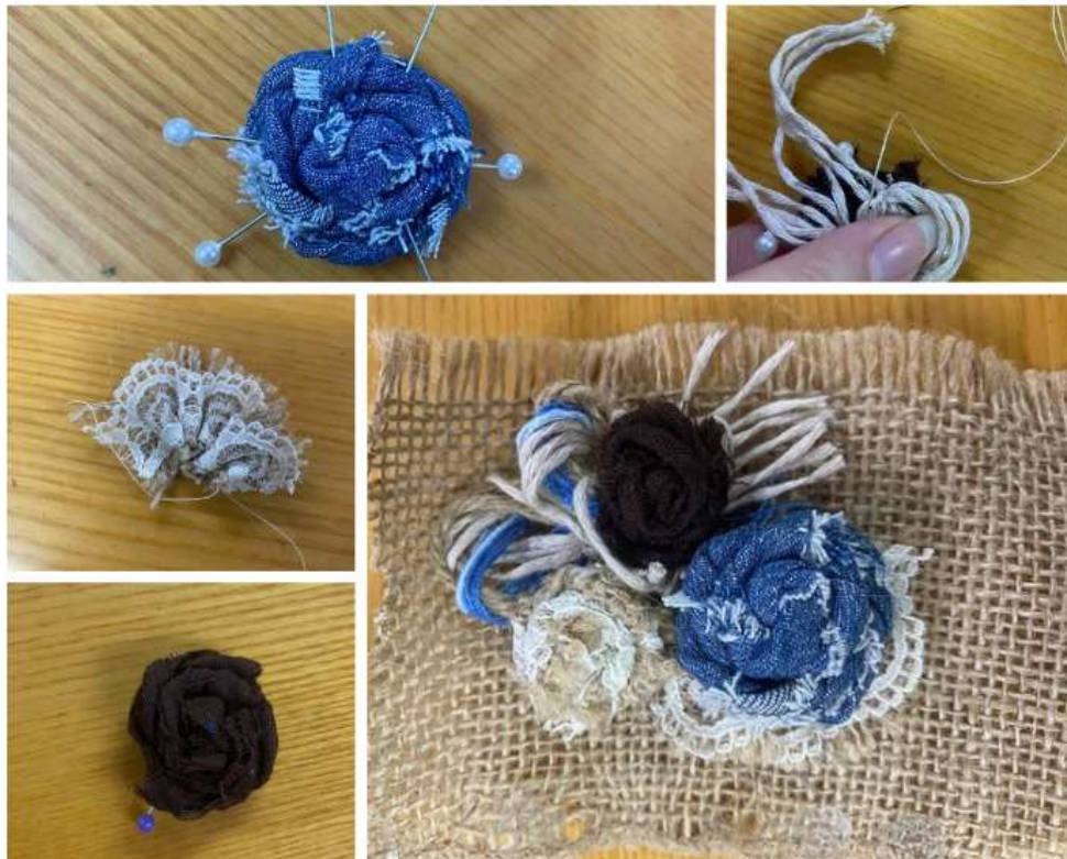
Рис 2. Процес покрокового створення троянд методом скручування та фіксації їх на основу

Робота з фактурою стала ключовим елементом творчості. Наприклад, використання виворотної сторони джинсу дозволило отримати ніжніші, пастельні відтінки, що контрастували з яскраво-синьою лицьовою стороною.